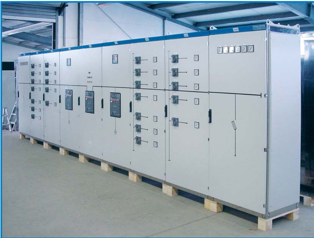
▲ versandbereite Anlage