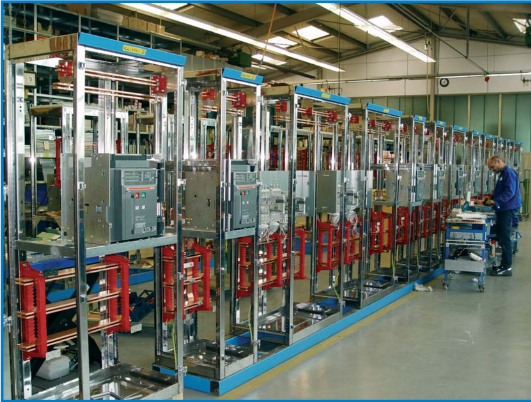
▲ Modul-K-System im Aufbau