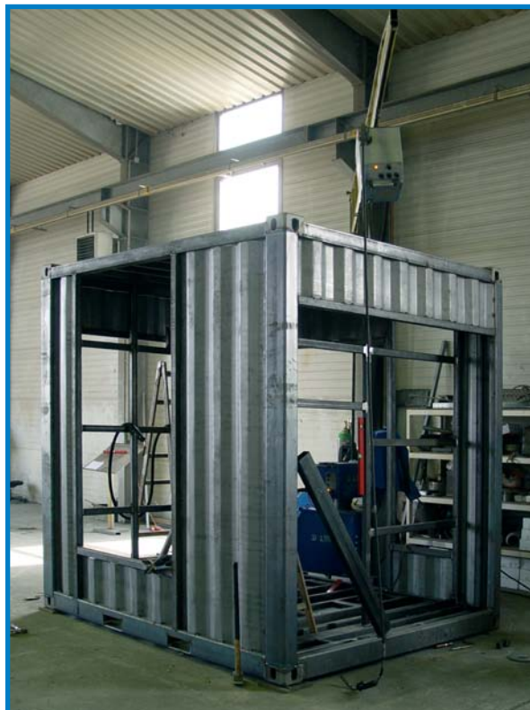
▲ Bereits beim Containerausbau legen wir größten Wert auf Qualität und äußerste Maßhaltigkeit