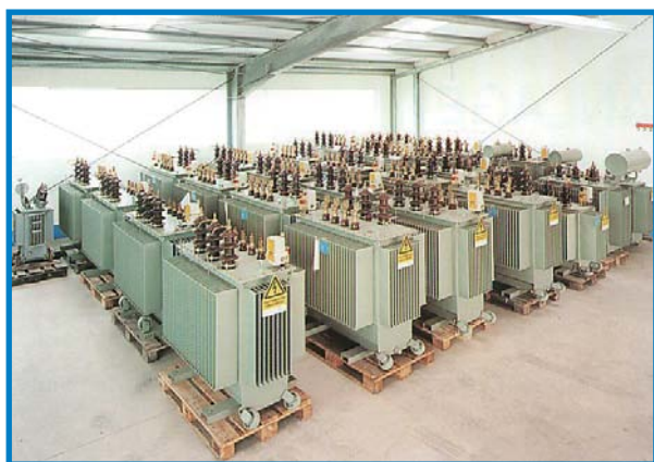
▲ Teilansicht unserer Lager-Transformatoren zum schnellen Ausbau der Baustrom-Container-Transformatorstationen

PEHLA, gegründet 1960, vereinigt unter ihrem Dach die Hochleistungsprüffelder Deutschlands und der Schweiz. Sie führt in ihren Prüffeldern Typ- und Entwicklungsprüfungen für in- und ausländische Betreiber und Hersteller von Geräten und Anlagen der elektrischen Energietechnik durch. Die PEHLA verfügt über sieben anspruchsvoll ausgestattete Einzelprüffelder, die seit 1992 von der Deutschen Akkreditierungsstelle Technik (DATEch) nach EN 45001 akkreditiert sind. Auf internationaler Ebene ist PEHLA Mitglied in der Short-Circuit Testing Liaison (STL).