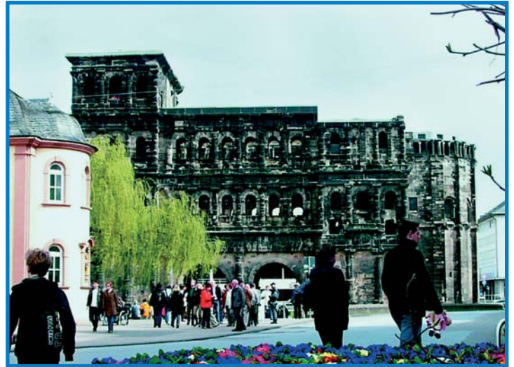
In Trier sind wir zu Hause

Haftung: Haftung für die Richtigkeit von Veröffentlichungen können wir trotz Prüfung nicht übernehmen. Die Veröffentlichungen erfolgen ohne Berücksichtigung eines eventuellen Patentschutzes. Auch werden Warennamen ohne Gewährleistung einer freien Anwendung benutzt. Änderungen in Konstruktion und Ausführung, die dem technischen Fortschritt dienen, bleiben vorbehalten.