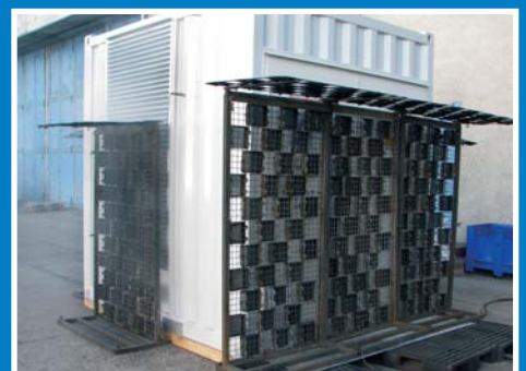
Nach der Prüfung