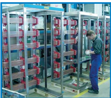
6300 A V 2 A-Felder mit Doppel-Sammelschienen für Netz und Netzersatz