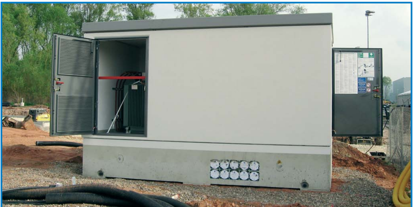
Begehbare Betonstation vor der Kabelverlegung und Verfüllung ▼