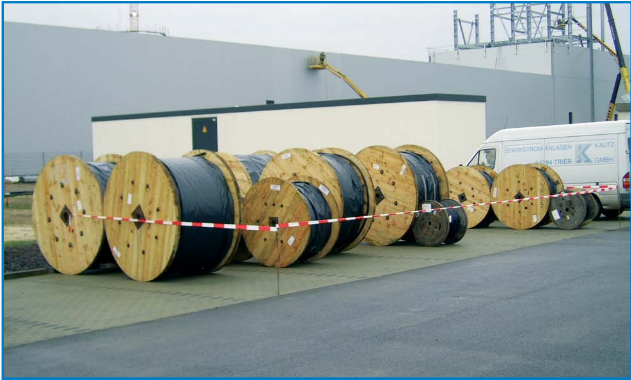
20 kV-Kabelverlegung ▲ ▼