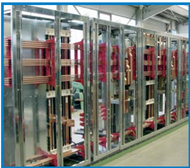
Rückwärtige Teilansicht von 4000 A Schaltfeldern