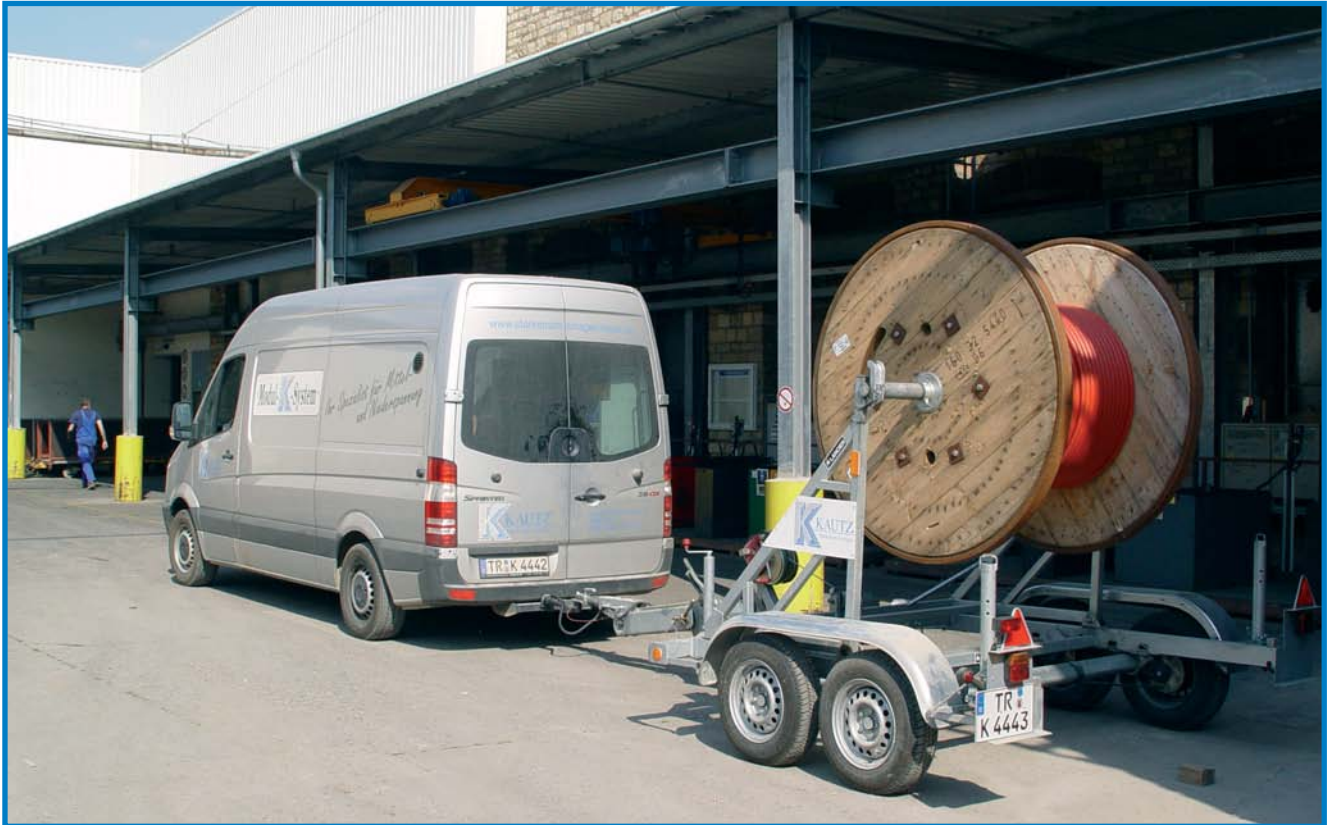
Kleinere Kabelstrecken ziehen wir direkt vom Anhänger ▲