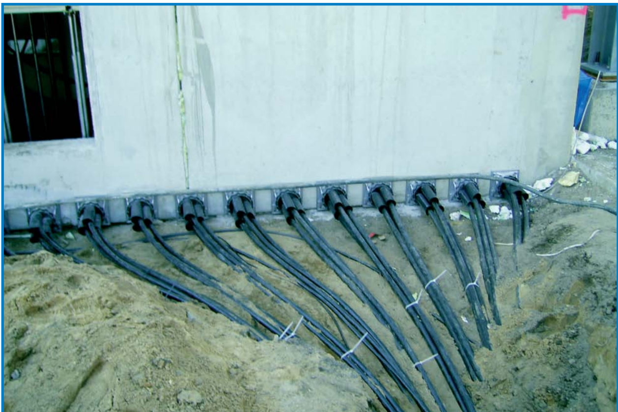
Hauff-Kabeleinführungen in eine 20kV-Unterstation (noch nicht zugeschrumpft) ▼