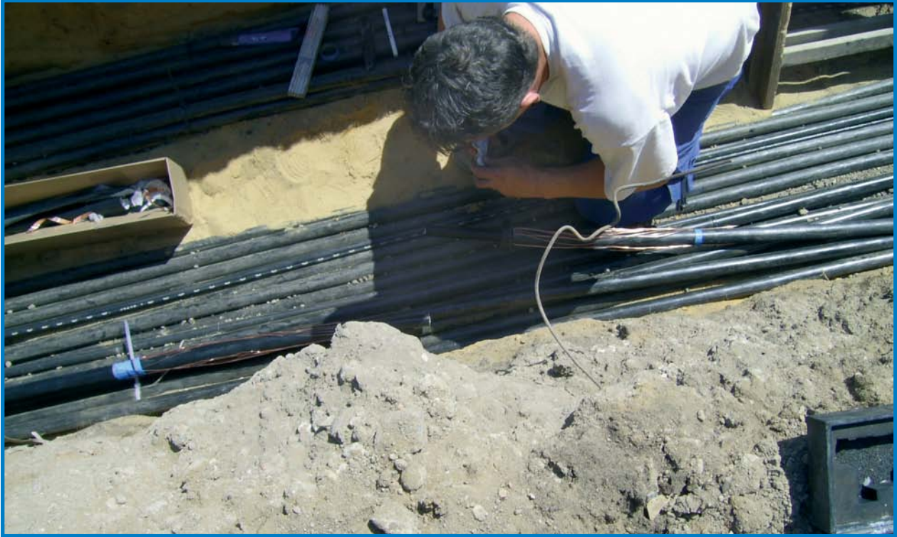
20 kV-Muffenmontage ▲