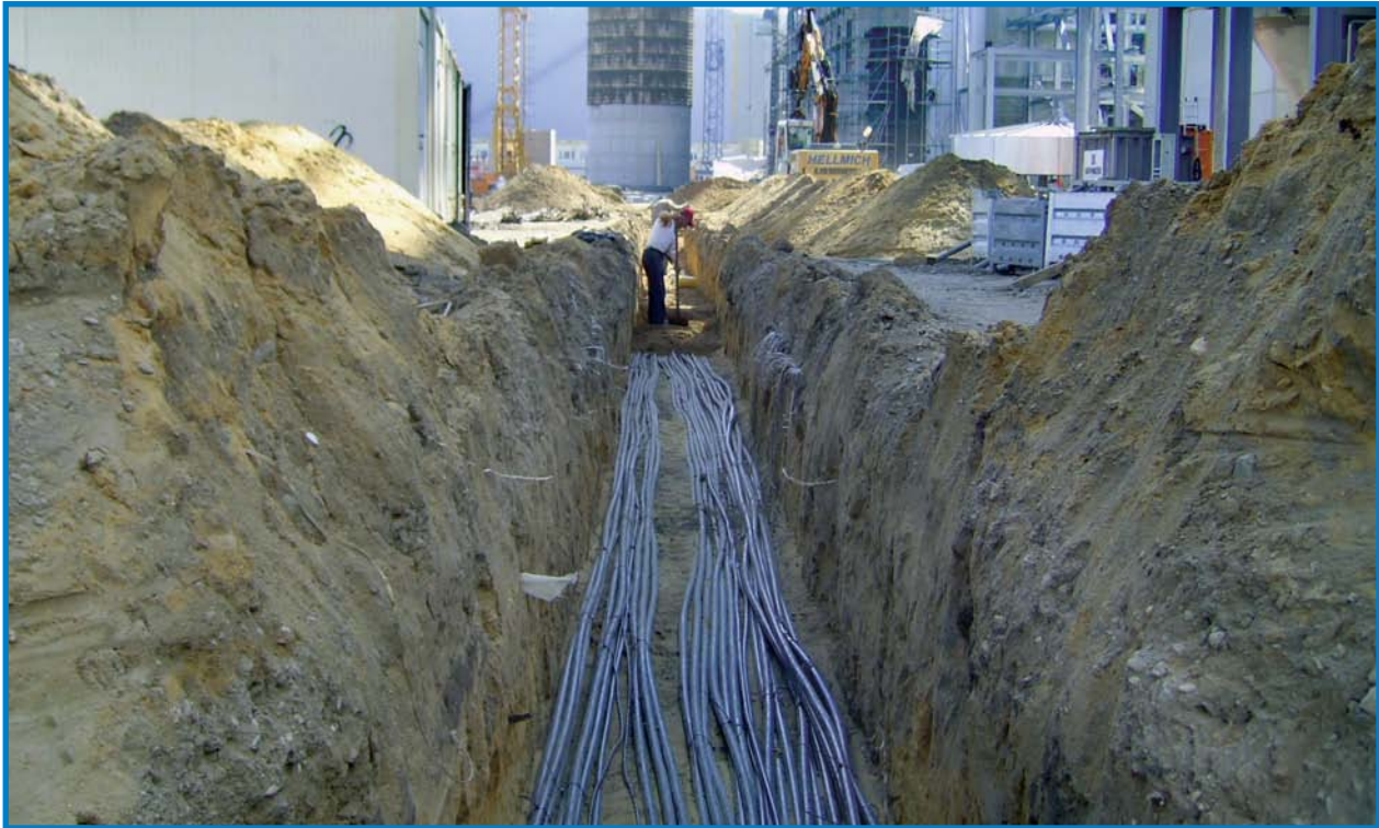
20 kV-Kabelverlegung in einem Fabrikgelände ▲