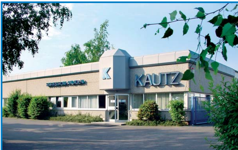
Firmensitz in Trier

Telefon-Nr.: 00352 474433 Telefax-Nr.: 00352 475150 e-Mail: kautz@pt.lu