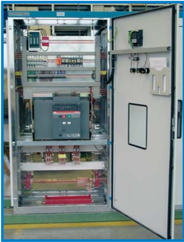
Einspeisefeld 4000 A

Keine unserer Schaltanlagen „ist von der Stange“ - Kundenwunsch wird bei uns groß geschrieben.