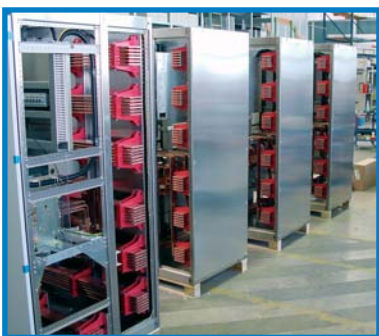
2 x 6300 A Doppel-Sammelschienenfelder mit geschlossener Rückwand